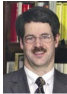
Dr.-Ing. Bau-Ing. Wolfram Schleicher Am Wasserturm 1 15732 Eichwalde