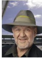
Architecte FAS/SIA, urbaniste FSU Rodolphe Luscher Luscher Architectes Boulevard de Grancy 37 CH-1006 Lausanne